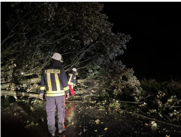
Nächtlicher Einsatz mit Kettensäge

Am Abend des 24. August wurde die Einsatzabteilung zu einem umgestürzten Baum auf der Sprakebüllers Strasse gerufen. Dieser Einsatz forderte uns, da der Baum doch sehr groß von seinen Ausmaßen war.